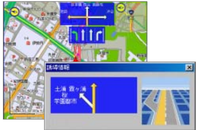
方面案内看板などの誘導情報

カーナビゲーションシステムでは、一般的な交差点拡大図や方面案内看板など、多数の誘導情報を提供します。また、信号機や一方通行などの情報も地図上に表示できます。