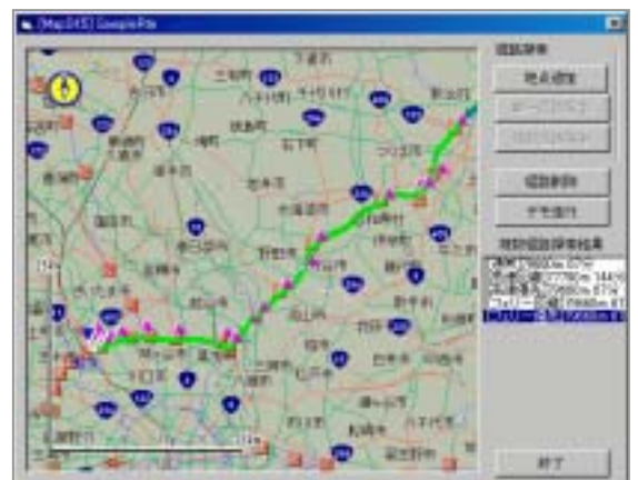
高度なルート探索機能

始点、終点のほか、複数の経由点を指定した高度なルート探索機能を提供しています。また、ルート探索に際しては、一方通行などの交通規制の考慮や、有料道路の利用の有無など細かな設定が可能です。