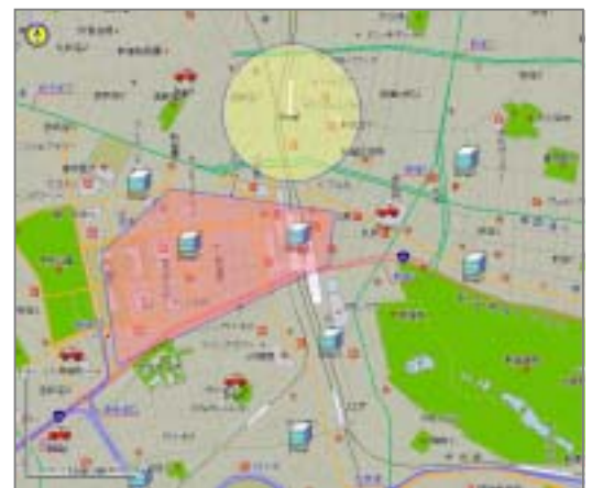
アイコン・テキストの描画

企業のロゴアイコンやタクシーのマーク、付箋を張るようなテキストの書き込み、商圏エリアを特定するための円表示、多角形表示など、多彩な描画機能を提供しています。