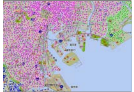
< 地図表示機能イメージ >