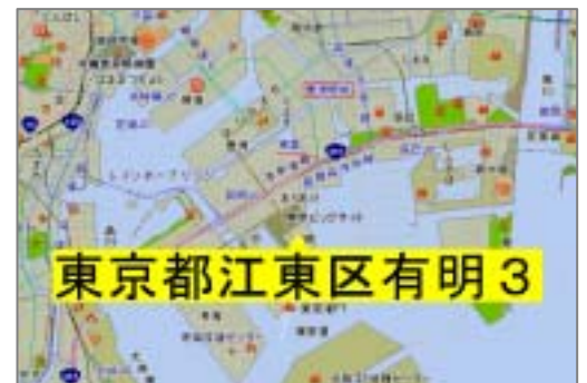
< 住所逆引き機能 >