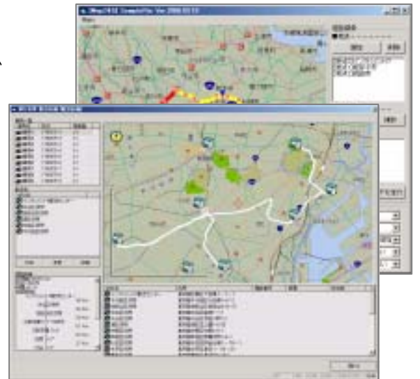
< 配送ルート計画システム(構築例) >