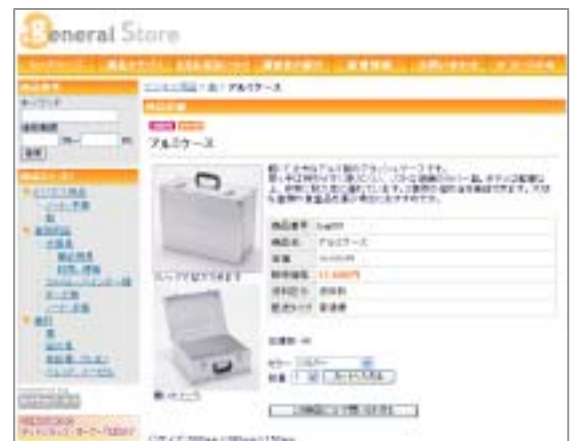
< サイトへのカート貼り付けイメージ >